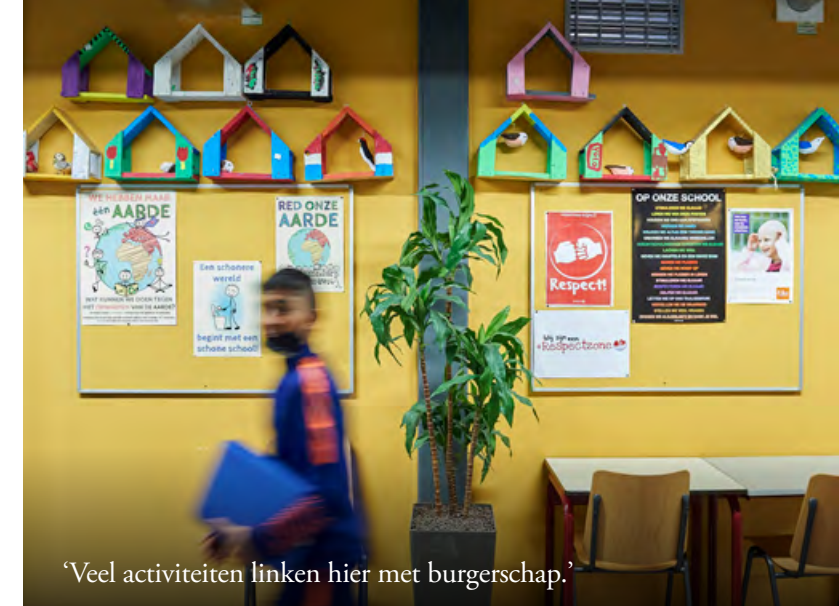
‘Veel activiteiten linken hier met burgerschap.’

Evalueren en bijstellen vindt Groenberg ook binnen de school belangrijk. “We zijn vaak geneigd om dingen te blijven doen zoals we gewend zijn, maar het is heel belangrijk dat we onze werkwijzen en ons gedrag bij durven te sturen als dat de sociale veiligheid ten goede komt.”