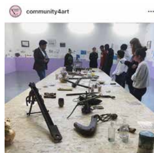
5 – Studenten vloggen op Instagram

De aangesloten instellingen geven aan van harte open te staan voor voortzetting in deze of een andere vorm. Daar zijn ook al projecten voor opgestart en gekoppeld aan opleidingen. Aan Zadkine nu de keuze om nog meer studenten zo’n traject bij kunst en cultuur instellingen te gunnen.