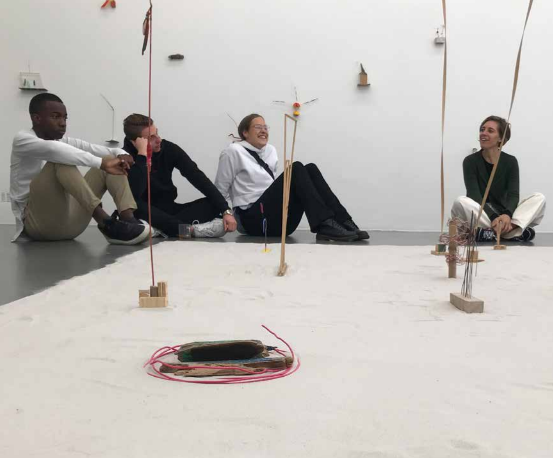
2 – Achter de schermendag bij WDW