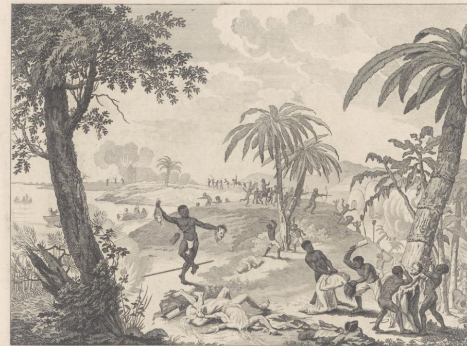
Opstand der NEGER-SLAVEN in de BERBICE, den 23 Feb r A o 1763.